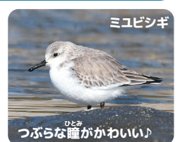
つづらな瞳がかわいい!

ミユビシギは、三番瀬では秋から春にかけて観察することが出来ます。冬羽になると白っぽくなって丸くてかわいいです。かわいさではシマエナガにも負けません!(大谷)