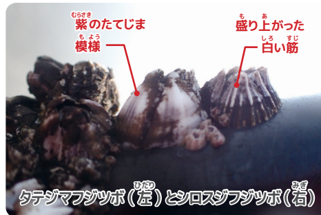
タテジマフジツボ(左)とシロスジフジツボ(右)

フジツボは貝のような殻をもちますが、実はエビやカニと同じ節足動物です。三番瀬では突堤の岩の表面などに見られます。ほとんどはタテジマフジツボですが、突堤の付け根、砂浜の近くではシロスジフジツボがまばらに見られます。