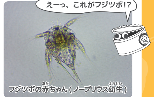
フジツボの赤ちゃん(ノープリウス幼生)

フジツボは、生まれたばかりのころは水の中をただよって暮らしています。そして成長するとセメントと呼ばれる水中接着剤によって岩などにくっつき、そこで一生を送ります。このセメントのくっつき力はすさまじく、簡単にははがれ落ちません。このとき、フジツボはくっつく場所を入念に選んでいます。海面からの高さ、まわりのフジツボとの密度など、多くの要因があると考えられています。